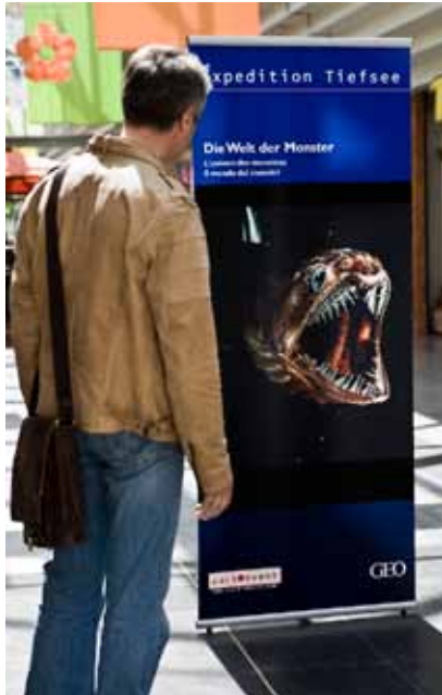
Roll-Ups (200 x 80 cm)

5 Roll-Ups mit verschiedenen Motiven aus der Ausstellung dienen der Bewerbung der Ausstellung im Bereich des EKZs.