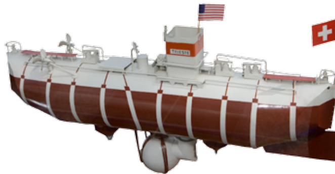
Vitrine: Modell „Trieste“ mit „Bathysphäre“ (120 x 50 x 125 cm)

Der Besucher sieht anhand des Modells, wie groß das Tauchboot selbst und wie klein, die vom Boot abgesetzte Tauchkugel ist. Das Modell stammt aus dem Museum in Nyon und entspricht in allen Einzelheiten dem Original.