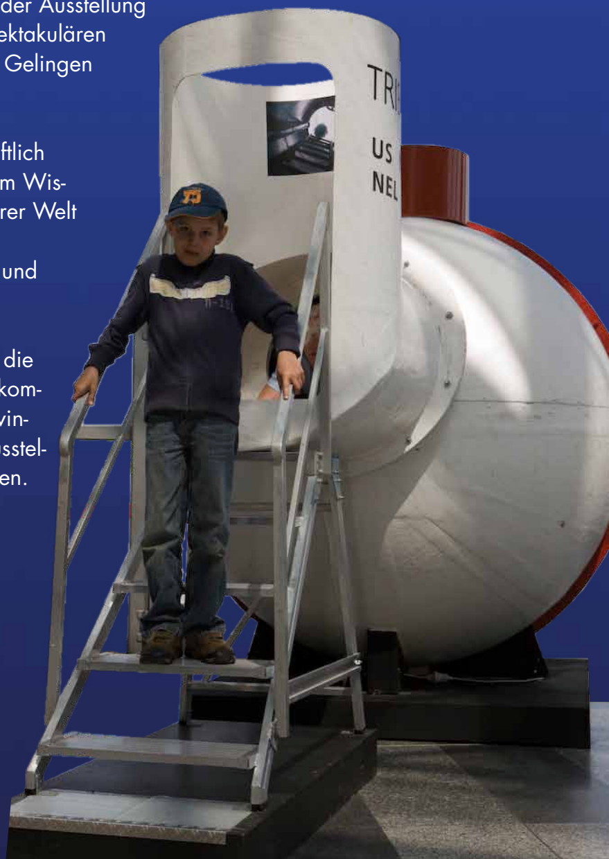
„Bathysphäre Trieste“ mit Einstieg und Treppe

Die Ausstellung besteht aus Modulen, die an verschiedenen Orten zum Einsatz kommen können. Eine Abfolge ist nicht zwingend. Besucher können daher den Ausstellungsbesuch bei jedem Modul beginnen.